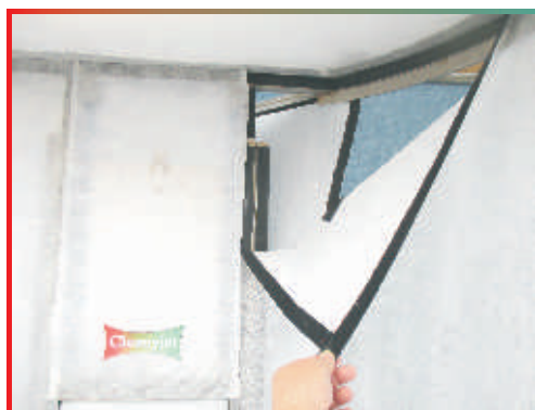
Leicht austauschbare Faservlieshüllen (an 5 Flächen) mit Klettverschluss.

Erst nach vielen Lackiervorgängen wird die preiswerte Faservlieshülle erneuert. Die Entsorgung der verbrauchten, trockenen Hüllen u. Filter ist in der schwarzen Tonne zulässig.