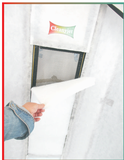
Leicht austauschbare Filtermatte.

Bei üblichen Kabinen mit festen Wänden verursacht das Overspray im Ansauggehäuse ein Anhaften bzw. einen strömungsungünstigen Aufbau an den Flächen. Das Reinigen bzw. Abwischen ist nur mühsam mit viel Zeitaufwand möglich.